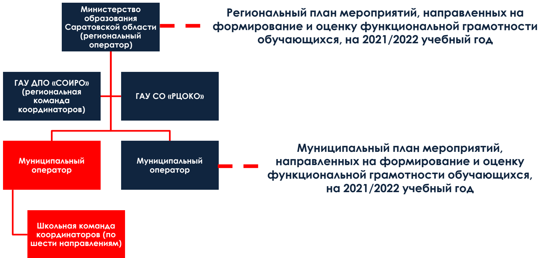
Схема взаимодействия с муниципалитетами / общеобразовательными организациями